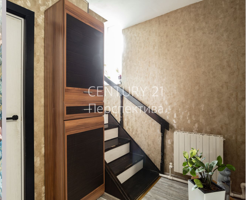
CENTURY 21 Перспектива