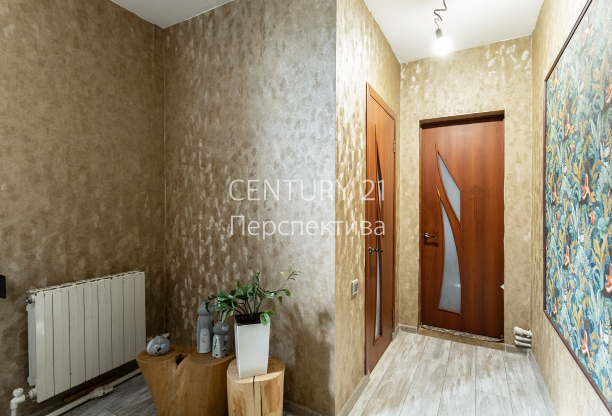
CENTURY 21 Перспектива