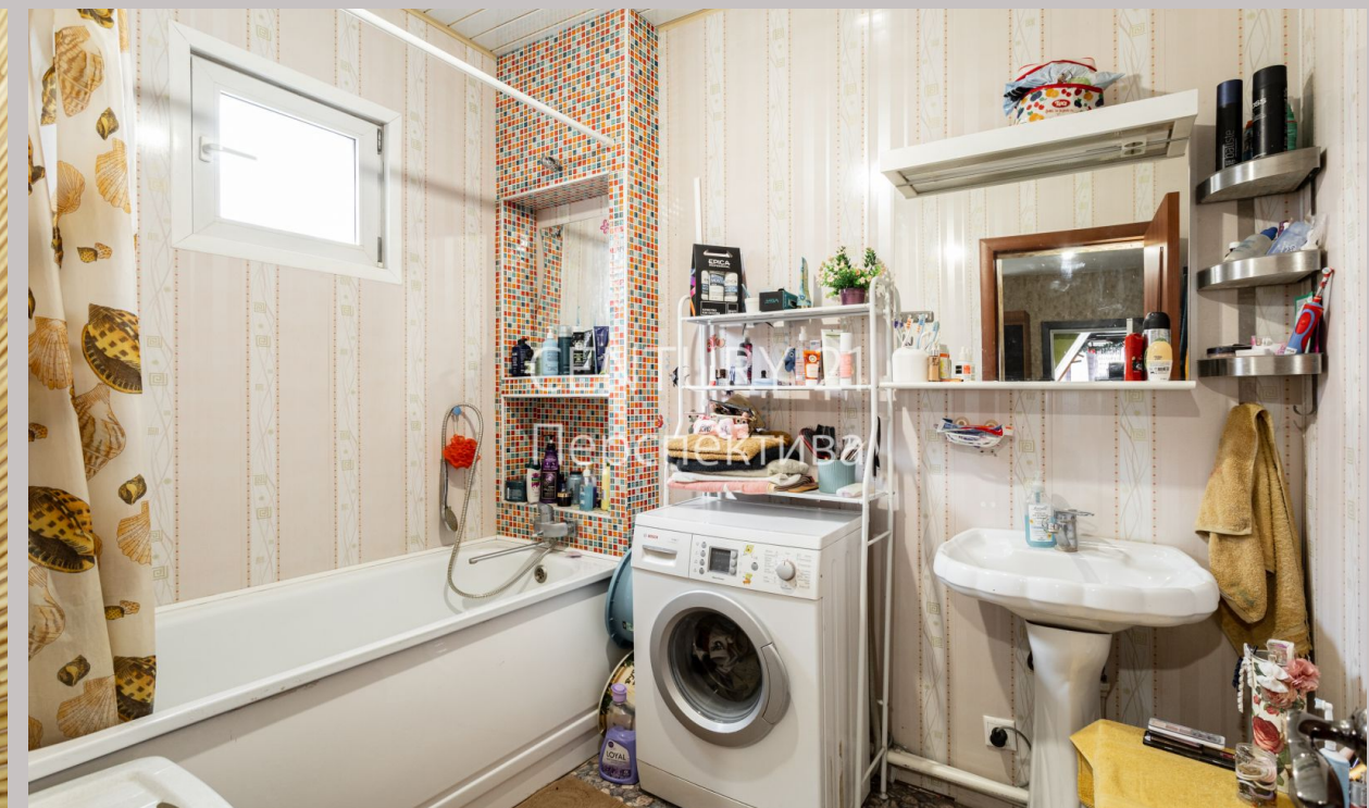
CENTURY 21 Перспектива