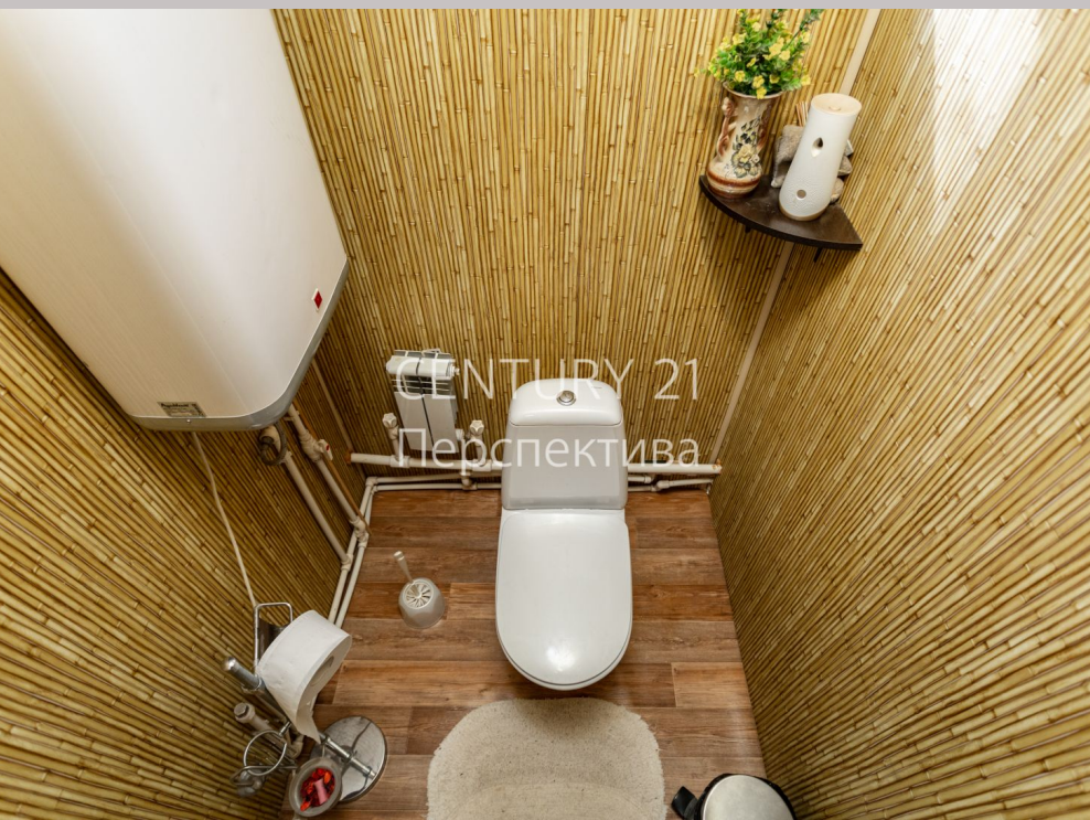
CENTURY 21 Перспектива