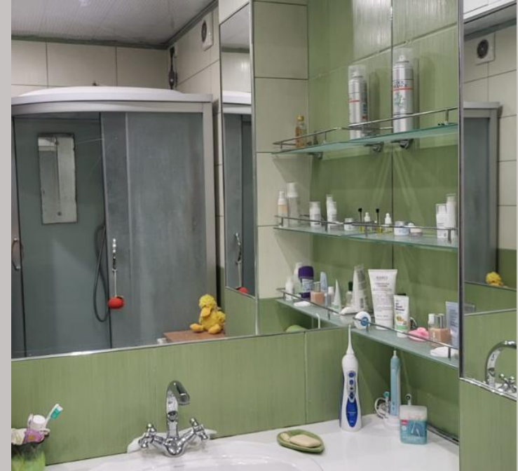
2-комнатная квартира Общая площадь 49,3 м 2