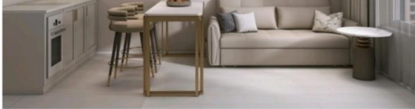
3D визуализация кухня - гостиная