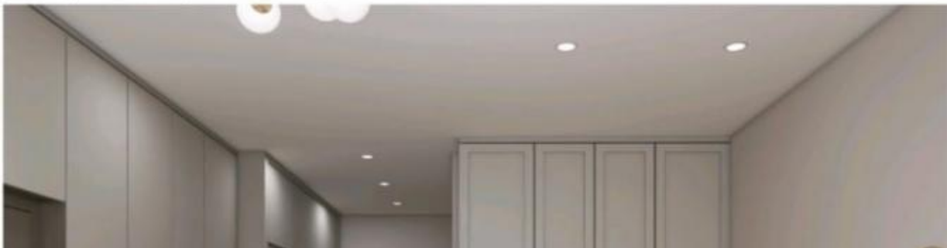
3D визуализация кухня - гостиная