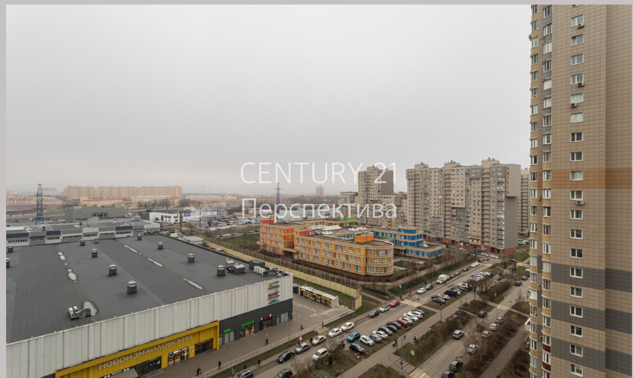
CENTURY 21 Перспектива