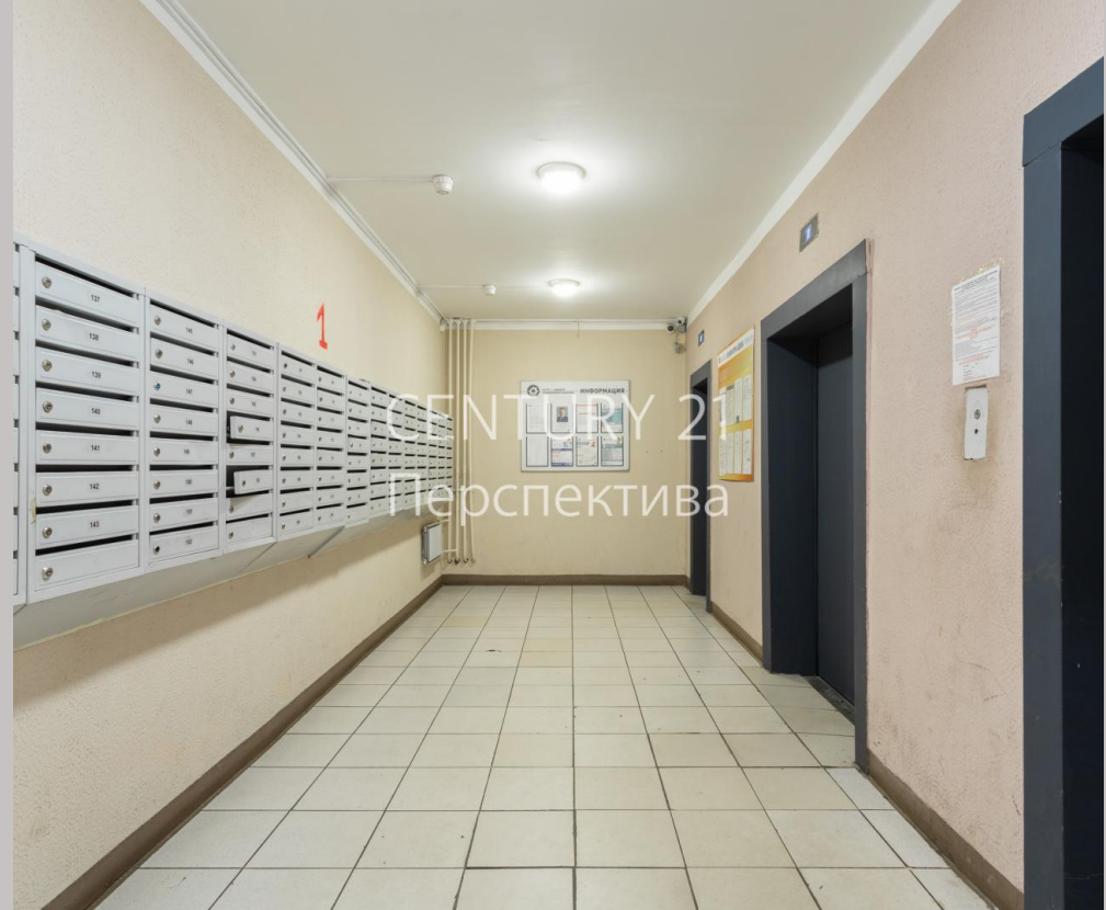
CENTURY 21 Перспектива