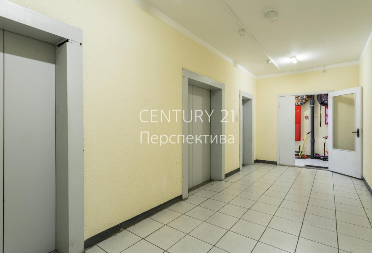
CENTURY 21 Перспектива