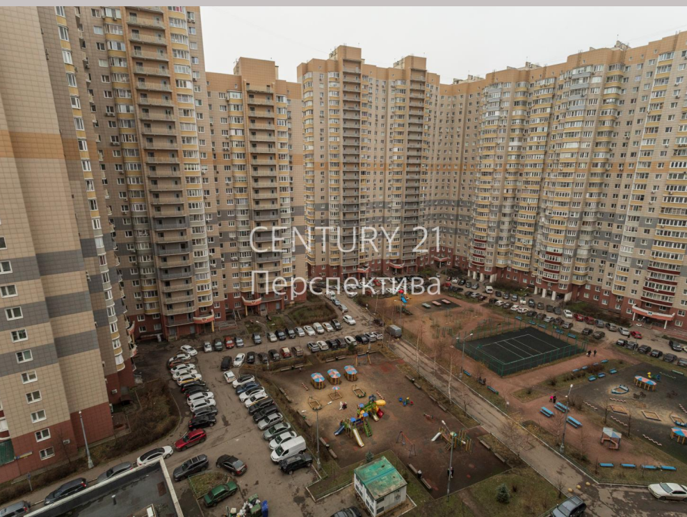
CENTURY 21 Перспектива