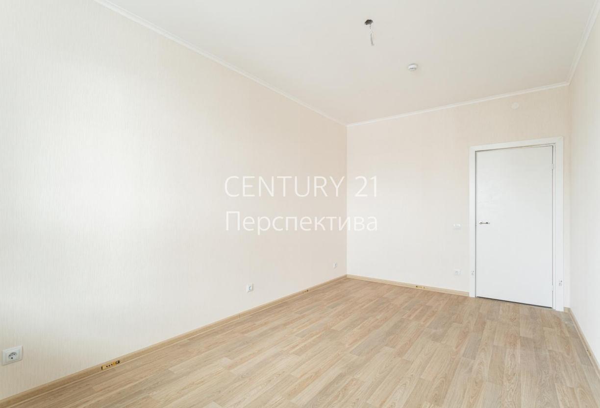
CENTURY 21 Перспектива