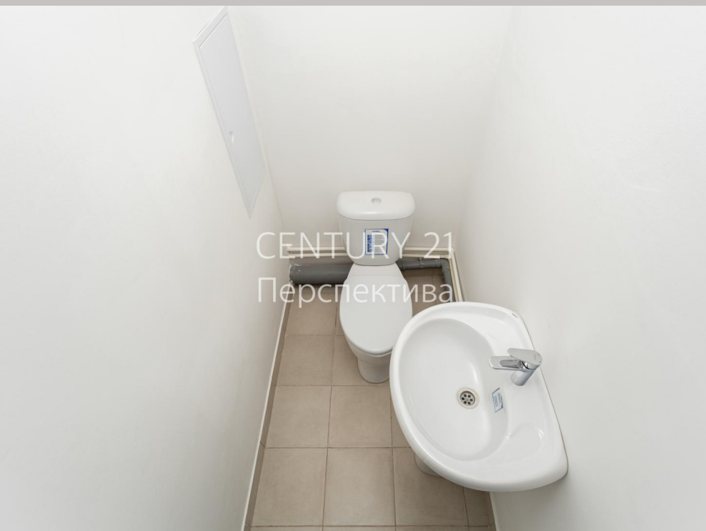
CENTURY 21 Перспектива