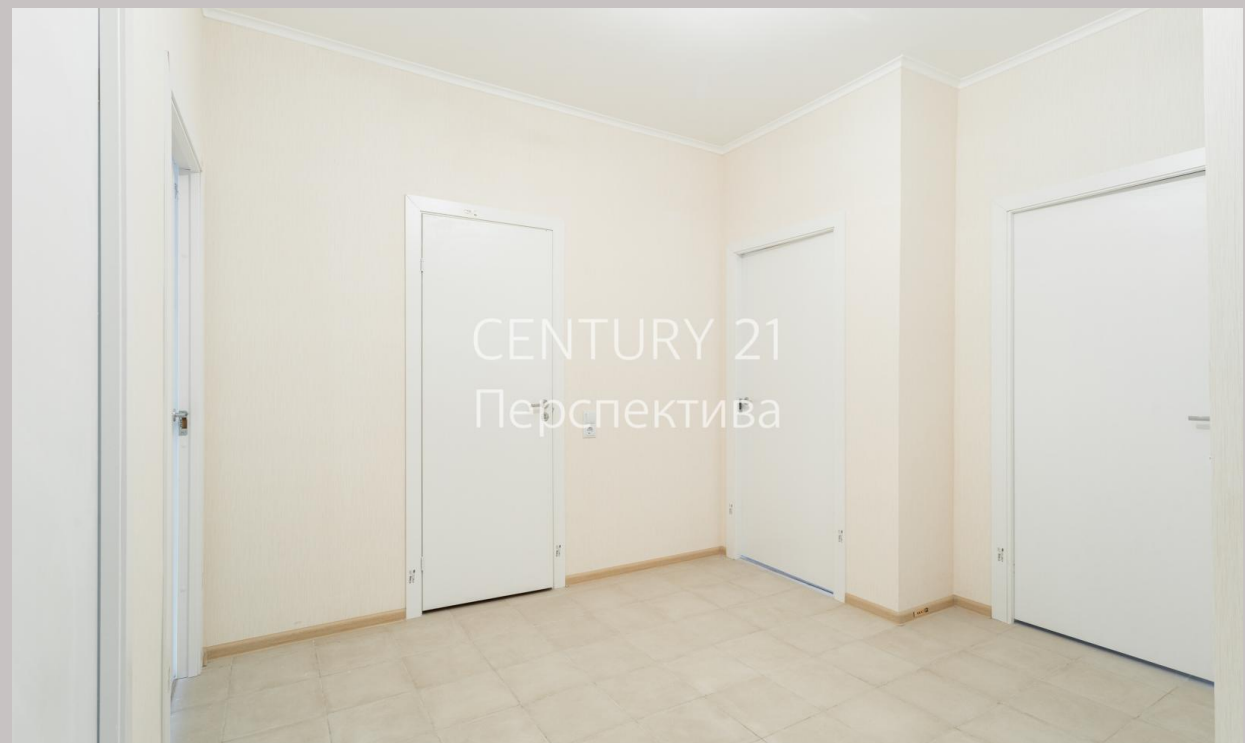
CENTURY 21 Перспектива