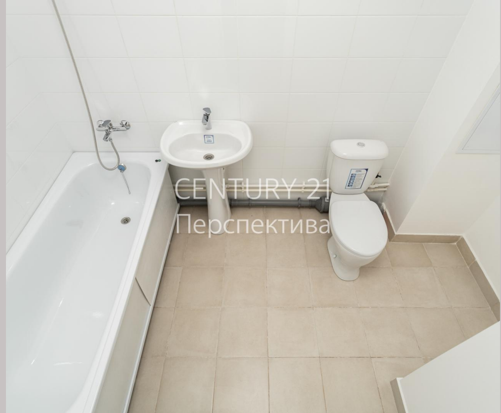
CENTURY 21 Перспектива