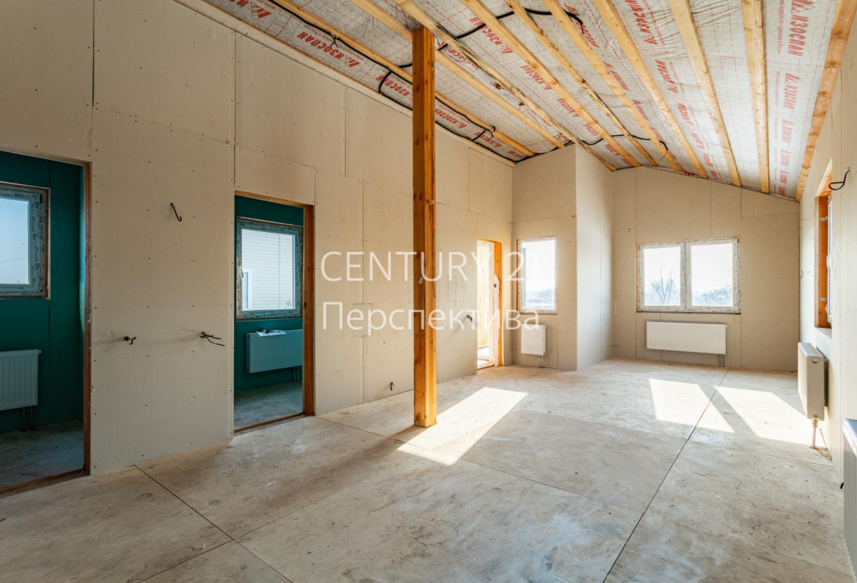
CENTURY 21 Перспектива