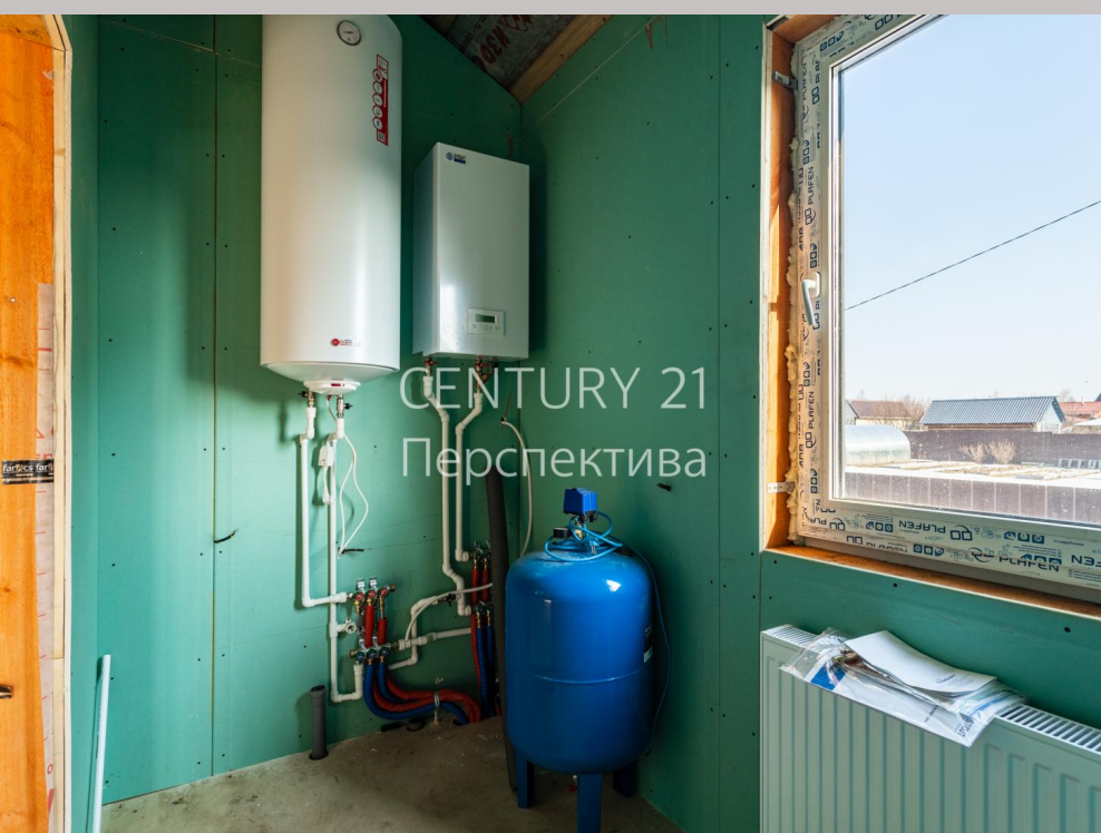
CENTURY 21 Перспектива