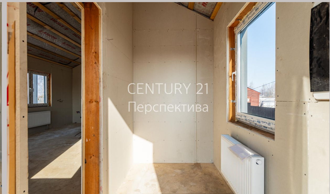
CENTURY 21 Перспектива