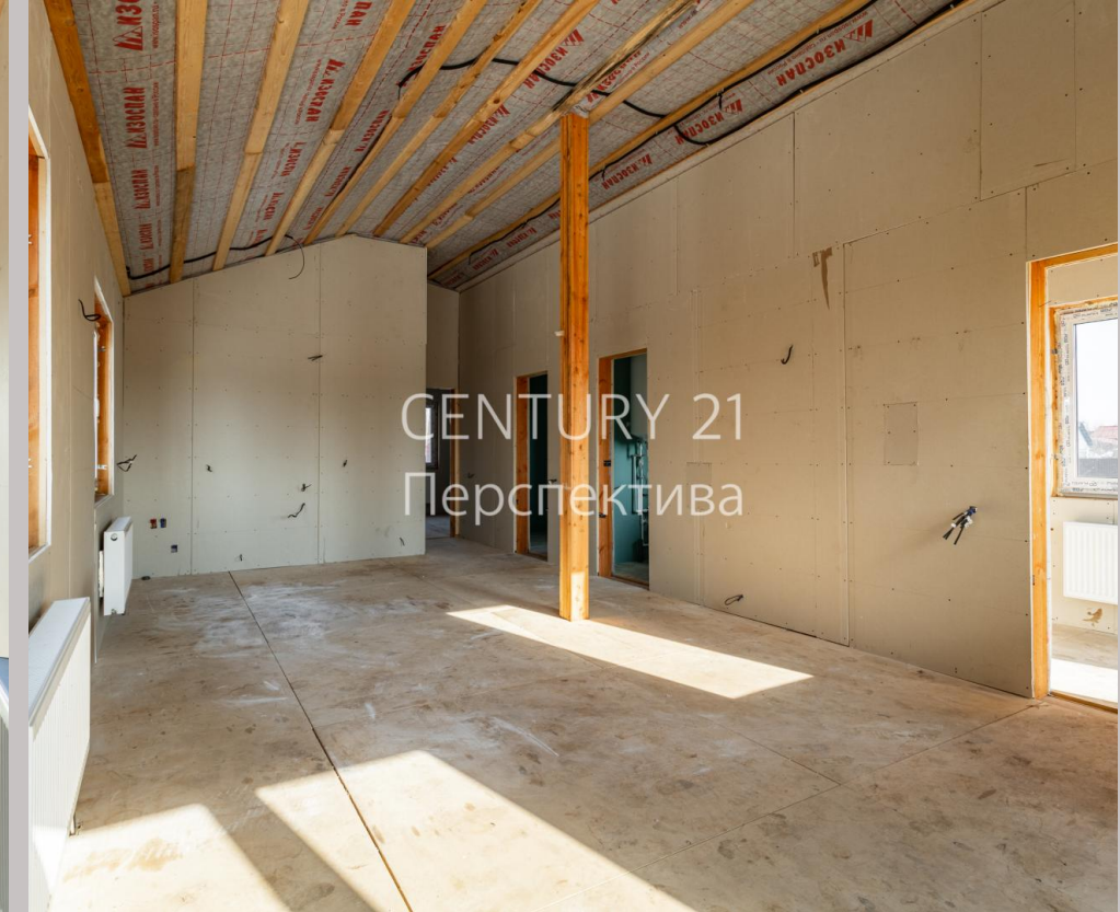
CENTURY 21 Перспектива