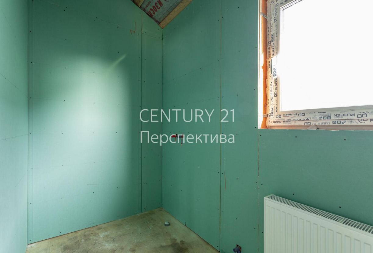
CENTURY 21 Перспектива