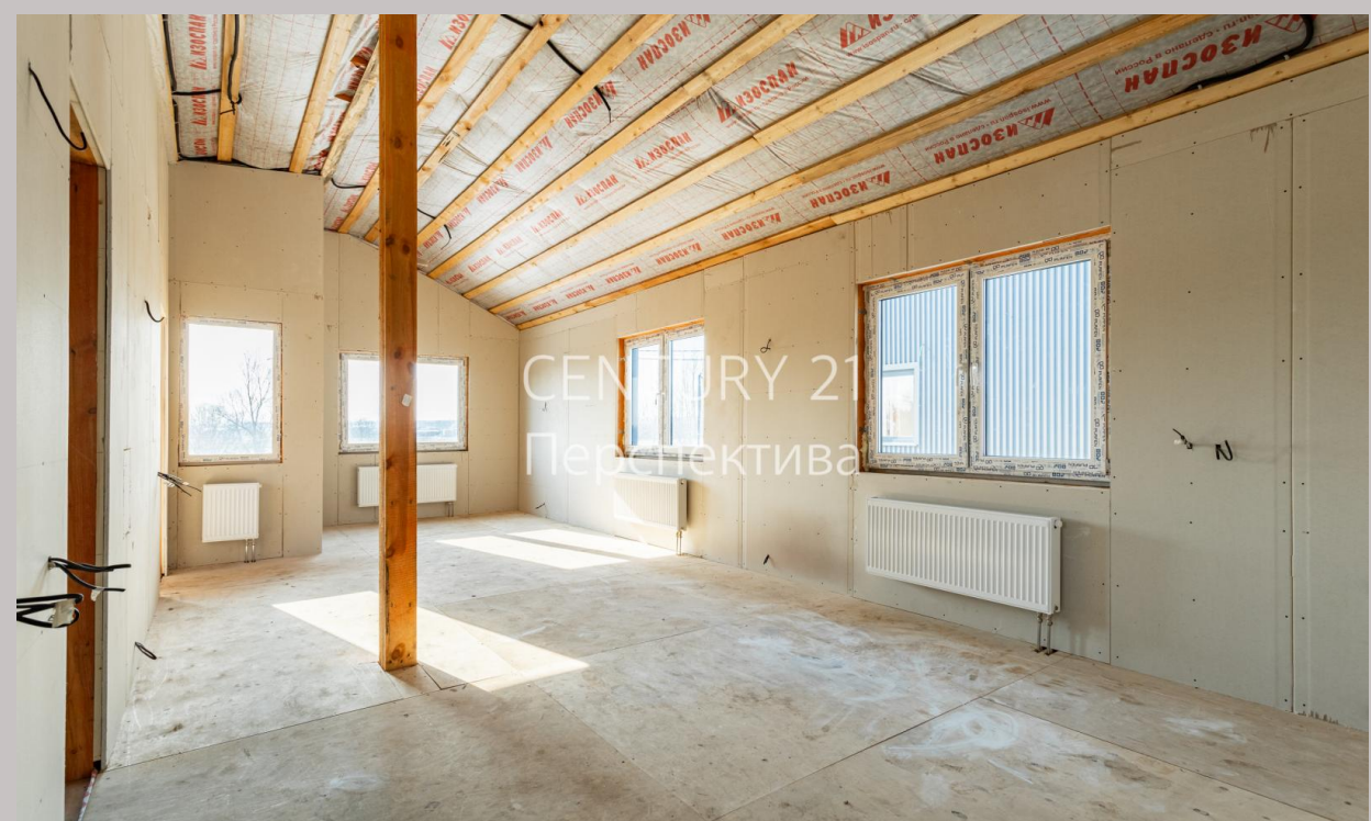
CENTURY 21 Перспектива