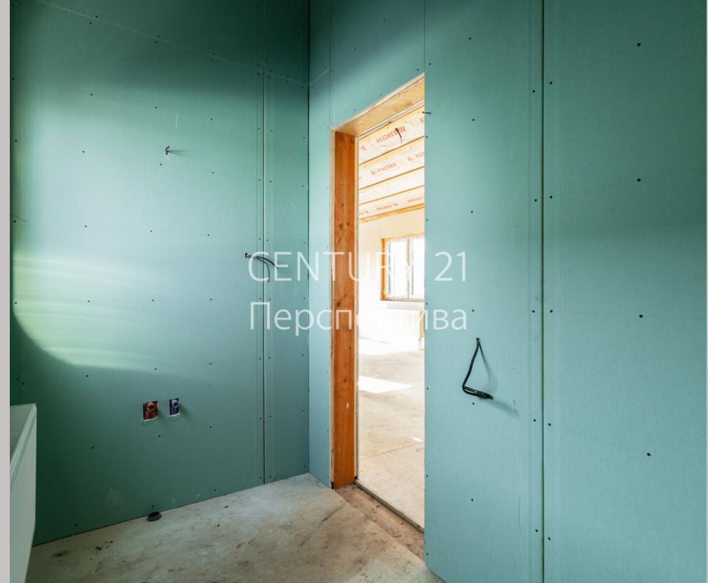
CENTURY 21 Перспектива