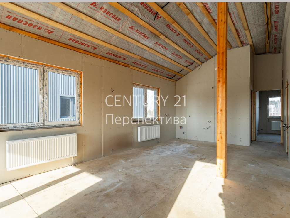
CENTURY 21 Перспектива