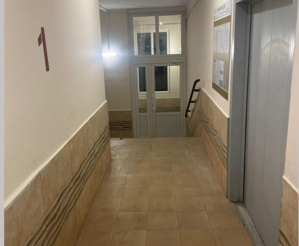
Комсомольский проспект, в. 10